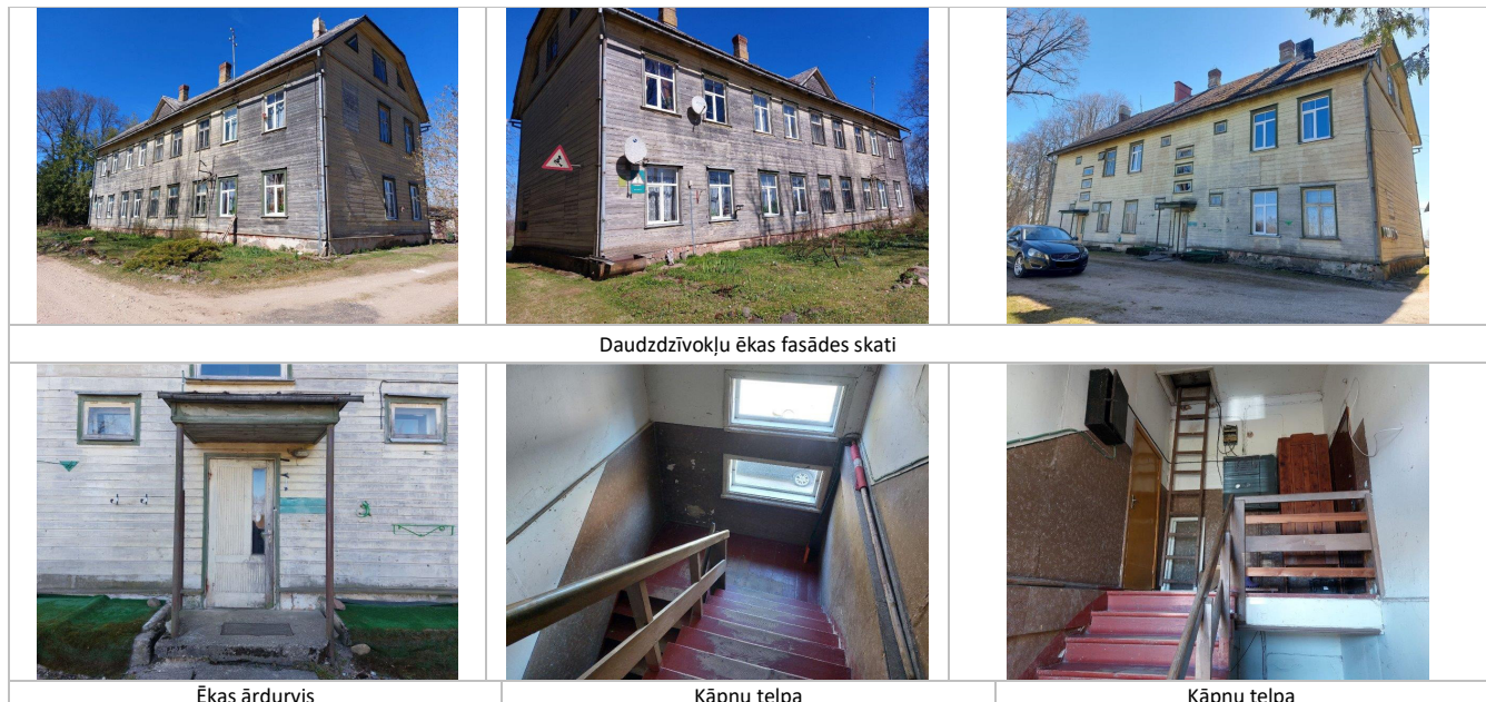
Daudzdzīvokļu ēkas fasādes skati